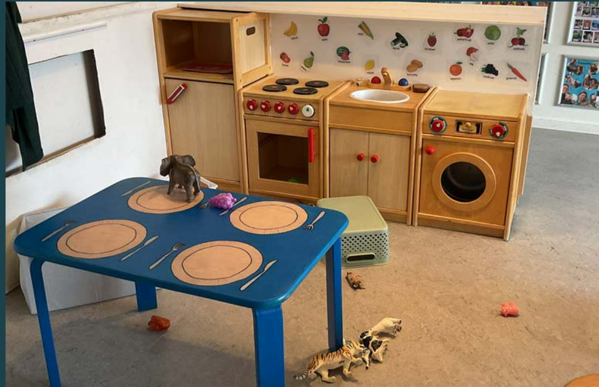
Tematiseret køkkenmiljø, der understøtter rolleleg, sprogudvikling og fælles udforskning