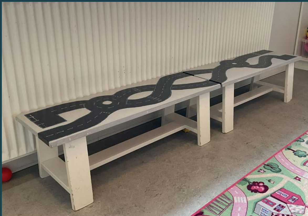
Fin bilbane, men fravær af køretøjer begrænser børnenes muligheder for rolleleg og fordybelse