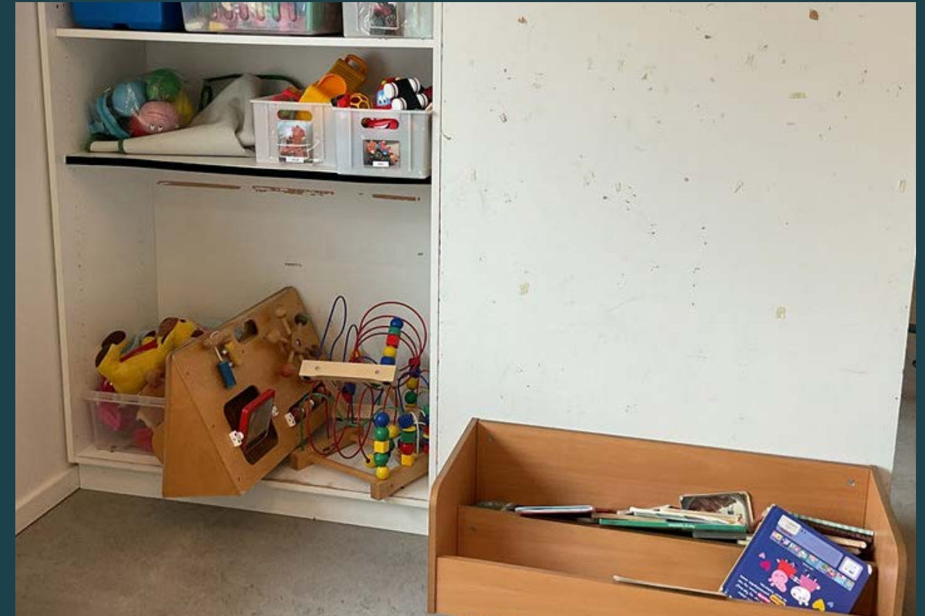
Reolen rummer en blanding af materialer, som kan skabe visuel støj og gøre det vanskeligt for børnene at orientere sig og vælge aktivitet.